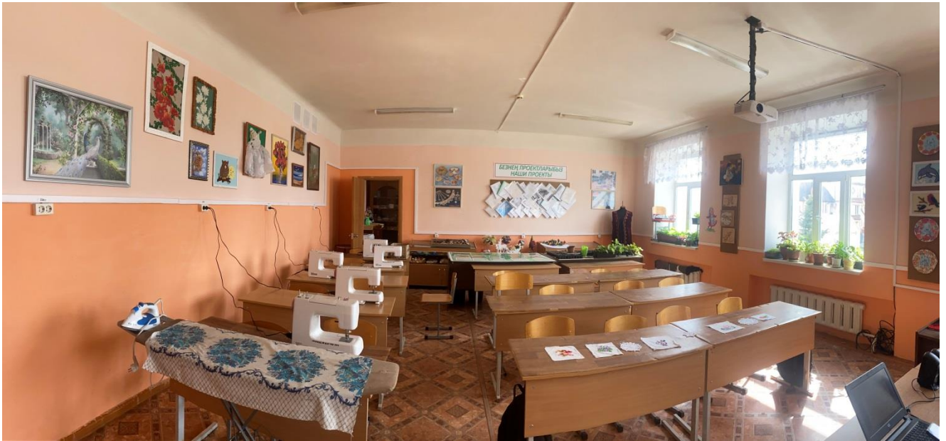
Кабинет швейного дела. Кабинет домоводства.