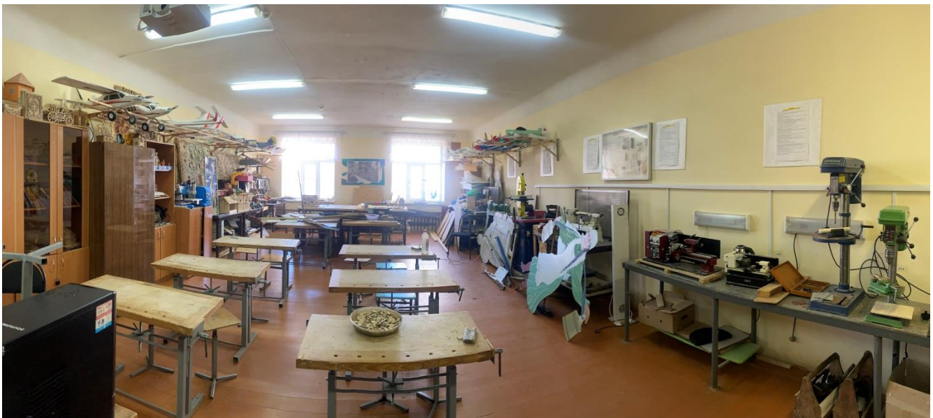
Кабинет столярной мастерской (кабинет технологии).